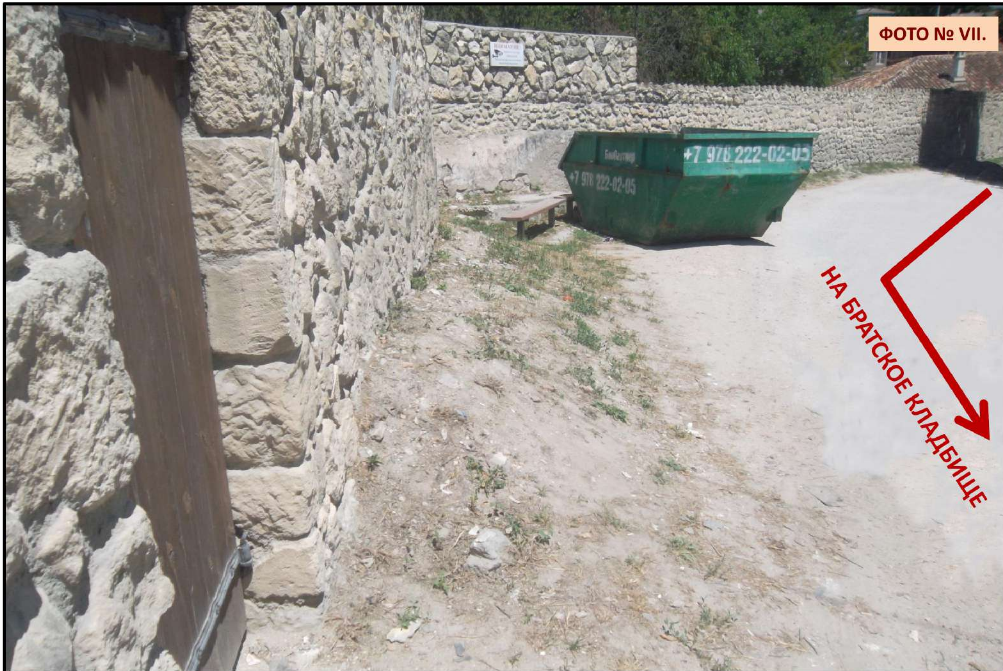
ФОТО № VII.

Город Бахчисарай. Запущенный и неблагоустроенный пер. Исторический. Предлагаемый чиновниками путь через задворки к братскому мемориальному кладбищу по ул. Речная, 133 является наглядным вызовом общественности и неприкрытым осквернением памяти погибших за Отечество.